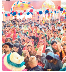
एक लाख भक्तों ने बाबा के दर्शन किए। कई गांवों से निशान यात्राएं डोल और डीजे के साथ मंदिर

नगर में स्थित श्री खाटूर याम मंदिर में डोल ग्यारस पर भक्तों की भारी भीड़ उमड़ी। मंदिर प्रबंधन ने उज्जैन से 51 किलो लाल गुलाब मंगवाकर बाबा का विशेष श्रृंगार किया। सुबह की आरती से ही भक्तों का आना शुरू हो गया। दोपहर और संध्या आरती में भी श्रद्धालुओं की भीड़ रही। शहर के साथ आसपास के गांवों और जिले भर से लोग दर्शन के लिए पहुंचे। एक दिन में करीब